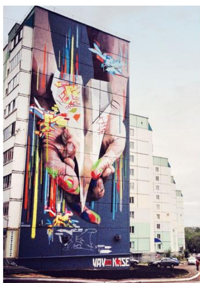
РАБОТА НЕМЕЦКИХ ГРАФФИТИ-ХУДОЖНИКОВ МАРКУСА ГЕНЕЗИУСА И АНДРЕАСА ФОН ШРАЗНОВСКИ

Город металлургов Магнитогорск, где на крупнейшем в мире комбинате трудится четверть горожан, — современный, многогранный мегаполис, расположенный одновременно в двух частях света - Европе и Азии. Он объединяет не только территории, но и населяющие их народы, национальные традиции, культуру. Исходя из этого, местная власть решила разрушить устоявшийся стереотип моногорода. Так родился новый бренд: «Магнитогорск — место встречи Европы и Азии».