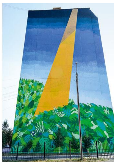
ИТАЛЬЯНЦЫ ГОЛА ХУНДАН И ДЖУДИ РУМ УКРАСИЛИ ФАСАД ЛУЧОМ СОЛНЦА

Первым шагом к повышению узнаваемости города, увеличению потока туристов, в том числе иностранных, стал проект под названием «Музей городов Европы и Азии под открытым небом» — один из победителей прошлогоднего конкурса «Лучшая муниципальная практика» в номинации «Урбанистика». Городские власти предложили художникам из разных европейских и азиатских стран оформить фасады