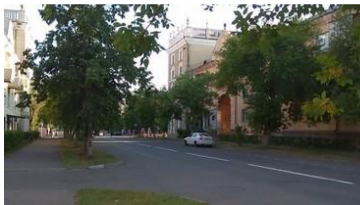
Дом Горького 12