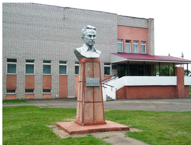
Музей А. Фадеева в Чугуевке