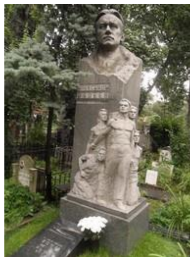
Памятник на могиле писателя

Предсмертное письмо Фадеева, адресованное ЦК КПСС, было изъято КГБ и опубликовано впервые лишь в 1990 году: