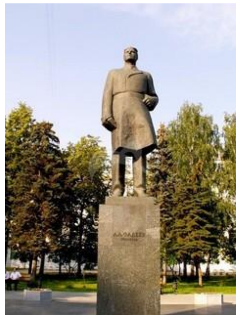
Памятник А. Фадееву в Москве