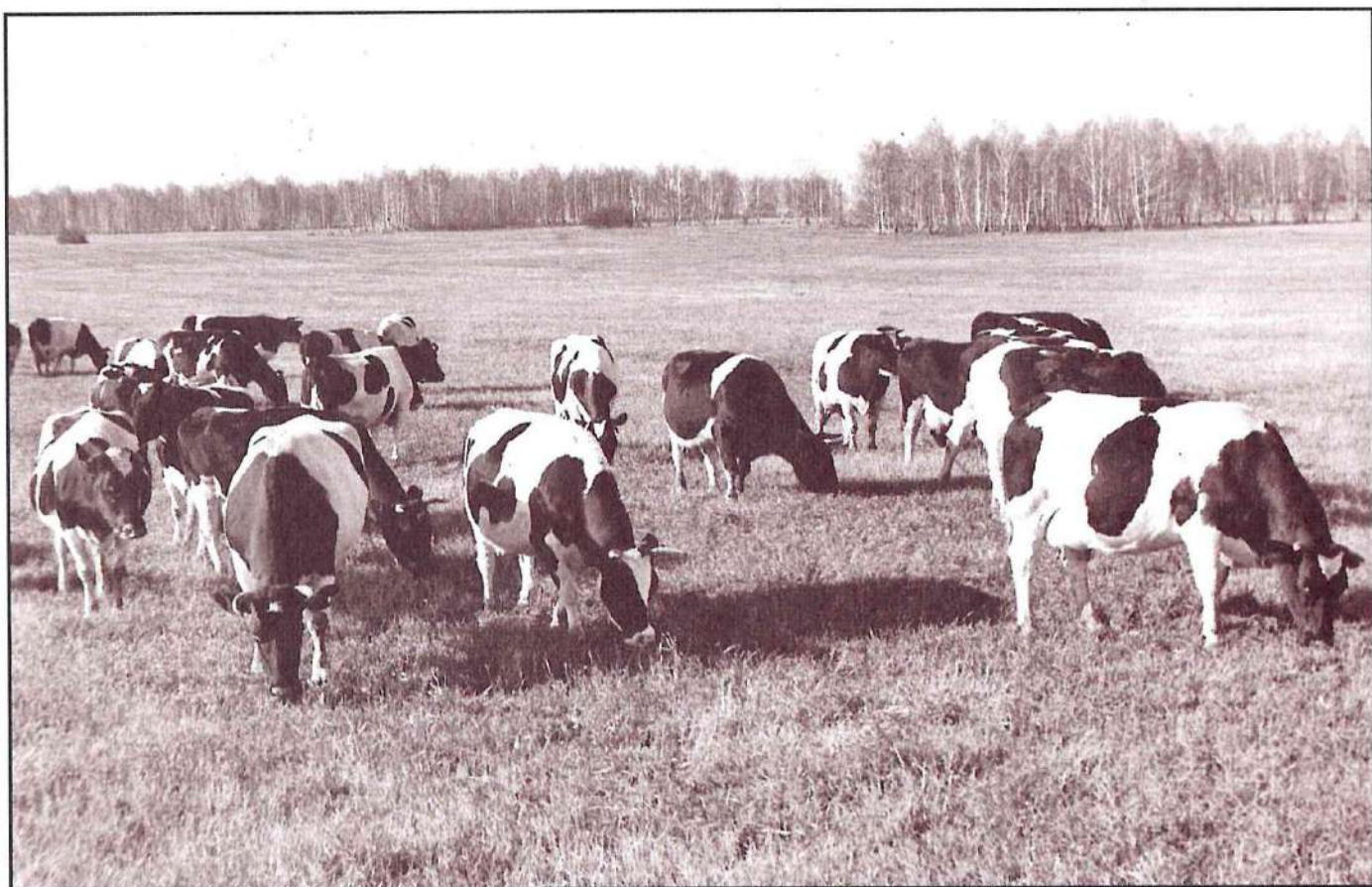
Ежедневная пятикилометровая прогулка коров.